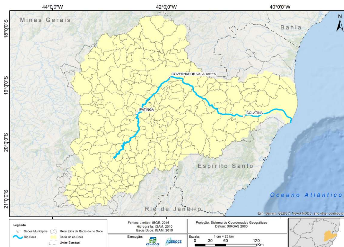
Figura 1 – Bacia Hidrográfica do Rio Doce