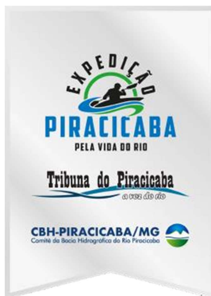
Figura 3 – Logomarca da Expedição Piracicaba

O desenvolvimento e os resultados alcançados pela Expedição serão desdobrados em produtos como filmes-documentários, exposições fotográficas, publicação de revista e o livro-relatório, que trará a descrição dos trabalhos desenvolvidos e conclusões da equipe técnica, além de quadro comparativo entre os dados de outras duas expedições realizadas no Piracicaba há 20 e 30 anos, respectivamente.