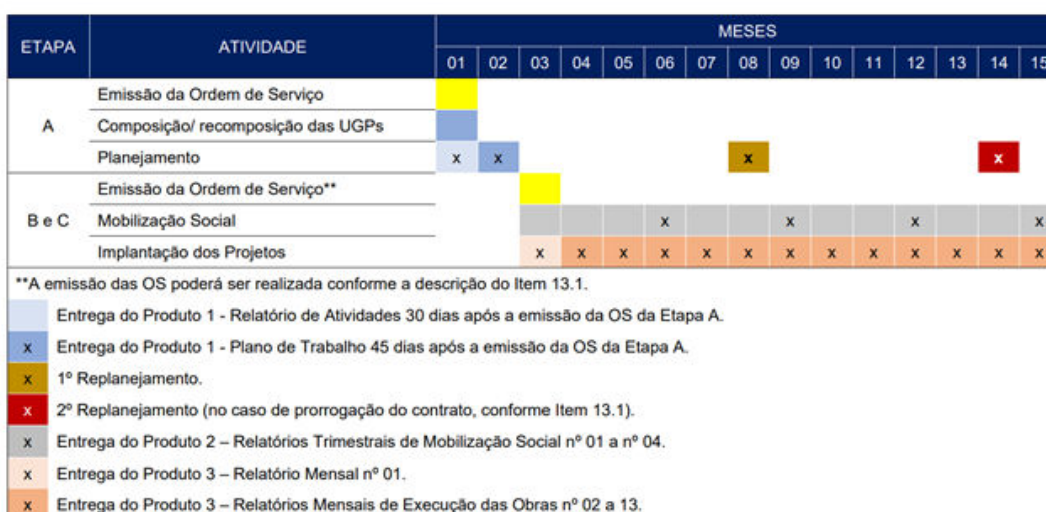
Figura 42 – Cronograma Físico