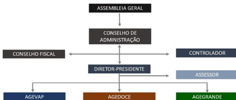
Figura 01 – Organograma da AGEVAP

A Associação é formada por uma Assembleia Geral, um Conselho de Administração, um Conselho Fiscal, uma Controladoria e uma Diretoria Executiva. Os membros dos Conselhos de Administração e Fiscal são pessoas físicas eleitas pela Assembleia Geral. A Figura 01 apresenta o organograma da AGEVAP.